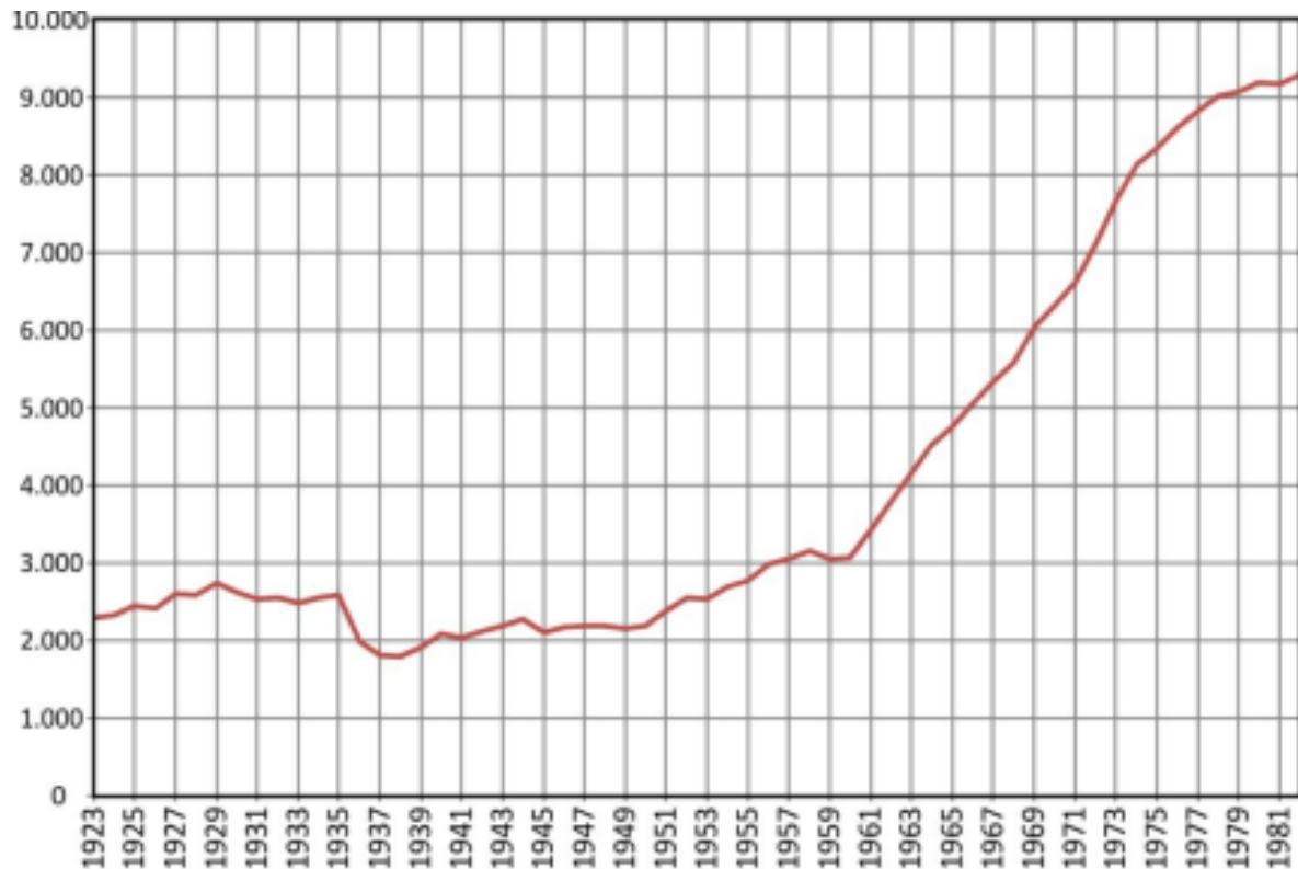
Doc. 2: Evolución del PIB per cápita español 1923-1982 (en dólares de 1990)